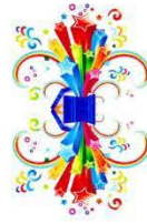
موسى نجيب موسى